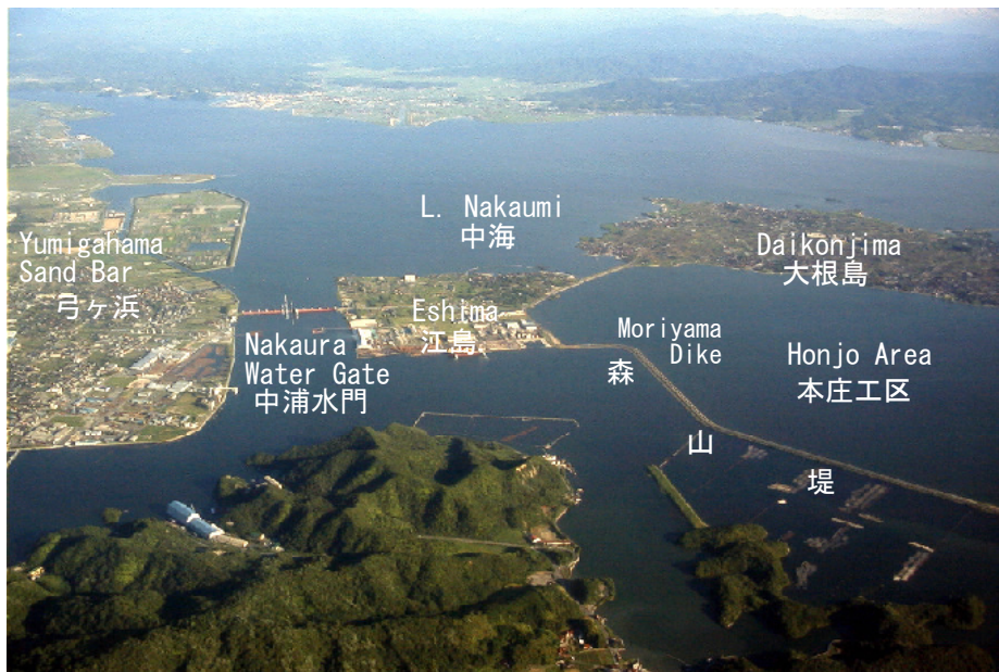
Fig.3 Bird View of the Honjo Area and L. Nakaumi 図3 島根半島側より中海方面を望む